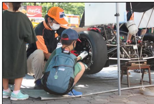
CSR（社会貢献） 地域交流